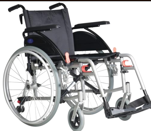
De getoonde productfoto kan afwijken van de standaard configuratie.

* = zitbreedtes 55 cm & 60 cm zijn enkel mogelijk in combinatie met zitdiepte 46 cm.